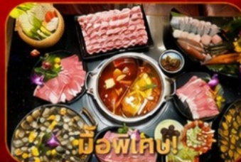
มือพิเค่ง! บุฟเฟ่ต์ชาบูสเตอ์อ่องกง