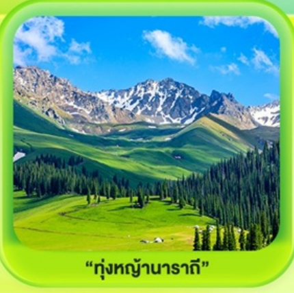
"ทุ่งหญ้านาราตี"