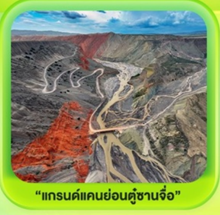
"แกรนด์แคนยอนคู่ชาวจื่อ"

ซินเจียงเหนือ ทะเลสาบโซลิมู๋ "น้ำตาหยดสุดท้ายของแอตแลนติก" • ทุ่งหญ้านาราตี ทุ่งดอกไม้เทียนซาน • ผ่านชมสะพานกั๋วจื่อโกว • ถนนหลิวซิงเจียง • ตลาดต้าปาจา