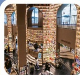
"ห้องสมุดจงซูเก๋"