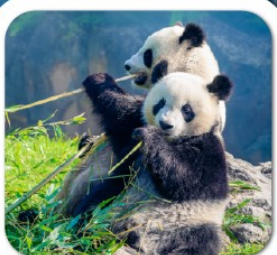
"ศูนย์หมีแพนด้า"