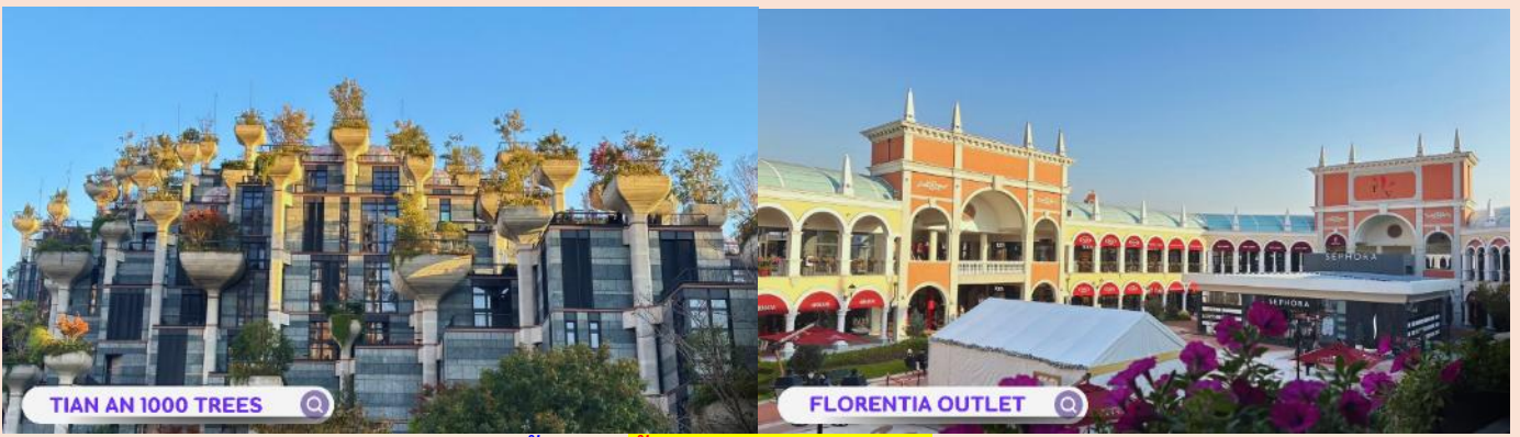
TIAN AN 1000 TREES