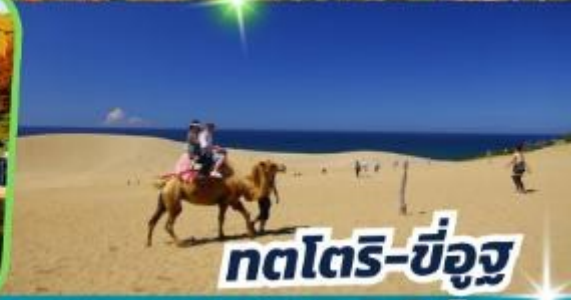
ทตโตริ-ซ็องสุ