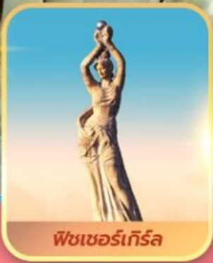
ฟิชเชอร์เทิร์ล