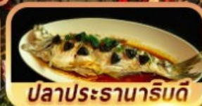
ปลาประรานาภิบดี