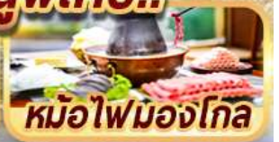
หม้อไฟมองโกล