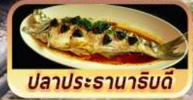
ปลาประจานาริบดี