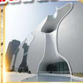
โรงละครไถจง