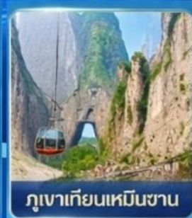
ภูเขาเทียนเหมินซาน