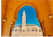
สุเหร่าแห่งกษัตริย์ฮัสซันที่ 2

06.10 น. เดินทางถึงสนามบินอิสตันบูล และเปลี่ยนเครื่อง 11.50 น. ออกเดินทางสู่สนามบินคาซาบลังกา เที่ยวบิน TK617 14.50 น. เดินทางถึงสนามบินคาซาบลังกา ประเทศโมร็อกโก