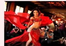
ชมระบำหน้าห้อง

** พักที่ Saray Pyramids & Museum View Hotel Hotel 4* หรือเทียบเท่า **