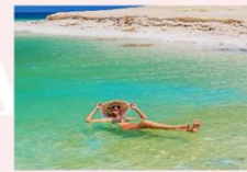
ทะเลเดดซี

** พักที่ Grand East Dead Sea Hotel 4* หรือเทียบเท่า **