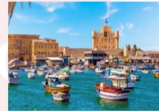
เมืองอเล็กซานเดรีย