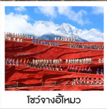
โซ่วจางอีไห่