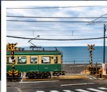
รถไฟโอบิโนะเด็น