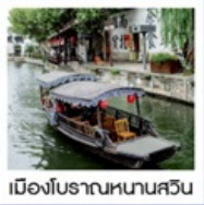
เมืองโบราณหนานสวิน