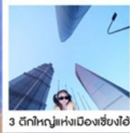
3 ตึกใหญ่แห่งเมืองเซี่ยงไฮ้