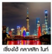
เซี่ยงไฮ้ คลาสสิก ไท่