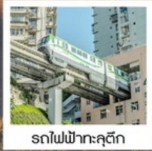
รถไฟฟ้าคุตัก