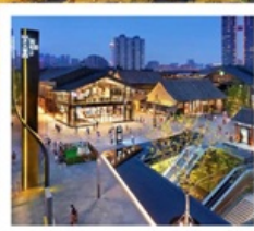
ถนนคนเดินไท่กู่หฺลี่