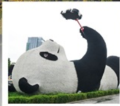
รูปปั้นแพนด้าเซลมี่