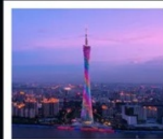
แคนตันทาวเวอร์