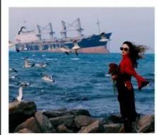
เรือบลูวิส

หอคอยกาลเวลา / รูปปั้นปลาวาฬ / ถนนโบราณเตาหยาง / ย่านสงโขว่ 1920 / เมืองเว่ยไห่ / ถนนฮั่วจวีปา / จตุรัสประตูแห่งความสุข ย่านอันลอฟ่าง / เรือบลูวิส / หาดซาจ้อฮั่ว / ถนนหลงเจียง / สะพานจันเจียว / หาดไซเบอร์ No. 3 ถนนจงซาน / โบสถ์ St.Emill / จตุรัส 54 / ศูนย์เรือใบโอลิมปิก / พิพิธภัณฑ์มิแยร์ชิงเต่า / ถนนโก๋ตง / ท่าเรือประมงเหยียนโก