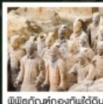
พิพิธภัณฑ์ทองคำฟิวดิ้น