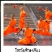
โชว์เส้าหลิน

ตลาดกลางคืนไคเฟิง / ประตูเมืองเก่าต้าหลี่หยิงเหมิน / สวนชิงหมิงซิงเหอ / อุทยานหุบโกซัน (รวมรถอุทยาน)