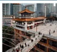
ตึก 22 ชั้น