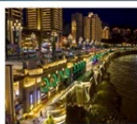
ถนนหนานปิ่น