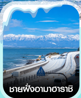
เขายังอำมาฮาราชิ