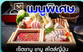
เมนูพิเศษ เซ็ทซาซิมิ ซาชิมิญี่ปุ่น