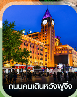
ถนนคนเดินหวังฝูจิ่ง

✈️ คอนเฟิร์มออกเดินทาง ✈️ ทุกพีเรียด 2 ท่านขึ้นไป