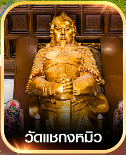
วัดแซกทมิว

✈️ คอนเฟิร์มออกเดินทาง ทุกพีเรียด 2 ท่านขึ้นไป