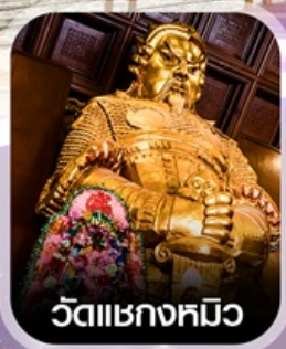
วัดเชกขมขว