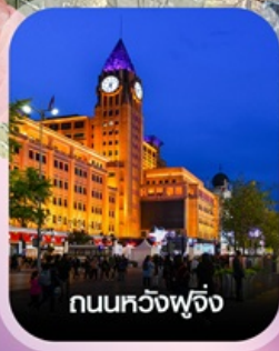
ถนนหวิงฟู่จิ่ง

✈️ คอนเฟิร์มออกเดินทาง ทุกพีเรียด 2 ท่านขึ้นไป