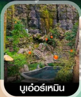
บูเออร์เหมิน