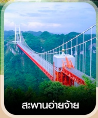
สะพานอ้ายจ้าย