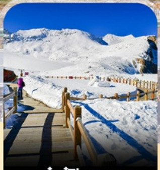
ต่ากู่ปิงชวน