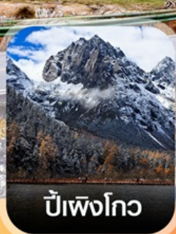
ปีเพิงโกว

✈️ คอนเฟิร์มออกเดินทาง ✈️ ทุกพีเรียด 2 ท่านขึ้นไป