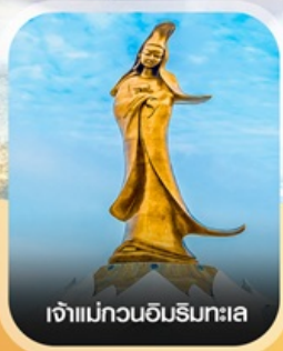
เจ้าแม่กวนอิมรับทะเล

คอนเฟิร์มออกเดินทาง ทุกพีเรียด 2 ท่านขึ้นไป