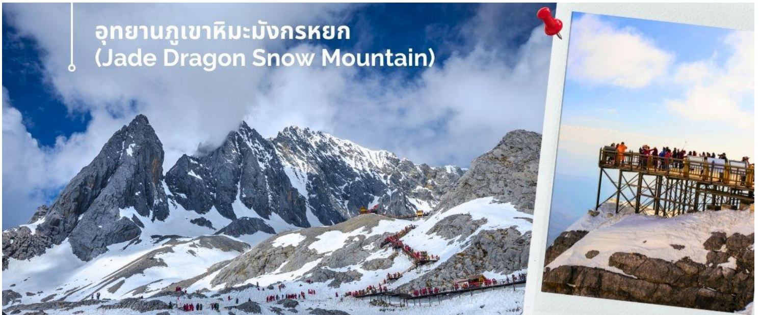
อุทยานภูเขาหิมะมังกรหยก (Jade Dragon Snow Mountain)

นำท่านชม อุทยานภูเขาหิมะมังกรหยก (Jade Dragon Snow Mountain) (รวมค่ากระเช้าใหญ่ ขึ้น-ลง) สู่จุดชม วิว ภูเขาหิมะมังกรหยก สูงจากระดับน้ำทะเล 4,506 เมตร ตั้งอยู่ในเขตปกครองตนเอง Yulong Naxi เมืองลี่เจียง มณฑลยูนนาน เป็นหนึ่งในสถานที่ท่องเที่ยวระดับ 5A เป็นอุทยานธรณีธารน้ำแข็งแห่งชาติ ครอบคลุมพื้นที่ 415 ตาราง กิโลเมตร และภูเขาหิมะมังกรหยกเป็นลูกคลื่นและมีลักษณะคล้ายมังกรเงินที่บินได้ตั้งนั้นจึงได้ชื่อว่าภูเขาหิมะมังกรหยก ยอดเขาหลัก ชานจีไต่ว์ อยู่สูงจากเหนือระดับน้ำทะเล 5,596 เมตร ล้อมรอบด้วยเมฆและหมอกตลอดทั้งปี เป็นยอด เขาบริสุทธิ์ที่ไม่มีใครพิชิตได้ ภูเขาหิมะมังกรหยกเป็นหนึ่งในจุดชมวิวที่มีชื่อเสียงในลี่เจียงและเป็นภูเขาศักดิ์สิทธิ์ในใจ ของชาวนาซี มียอดเขาทั้งหมด 13 ยอด อุดมไปด้วยทรัพยากรการท่องเที่ยวทางธรรมชาติ และสามารถแบ่งออกเป็น