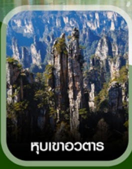
หุบเขาอวตาร

ฟรี ใส่ชุดชนเผ่าท้องถิ่น บัตร ลงจางเจียเจีย