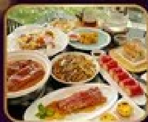
อาหารจีน 10 อย่าง