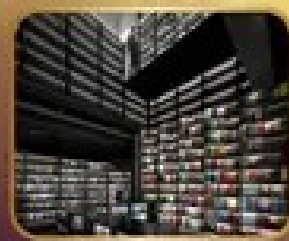
ชมร้านหนังสือ