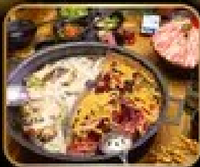
พิซซ่า เบเกอรี่ไฟฟ สุที่ หน้าไฟสโตรัสัน