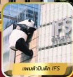
แพนด้าในตึก IFS