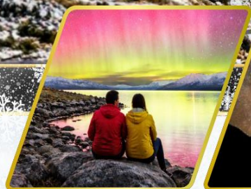
ตามล่าหาแสงใต้