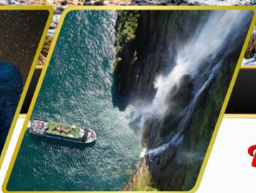
ล่องเรือมิลฟอร์ด ซาวน์