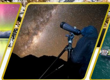
กิจกรรมชมทิวทัศน์ดาว