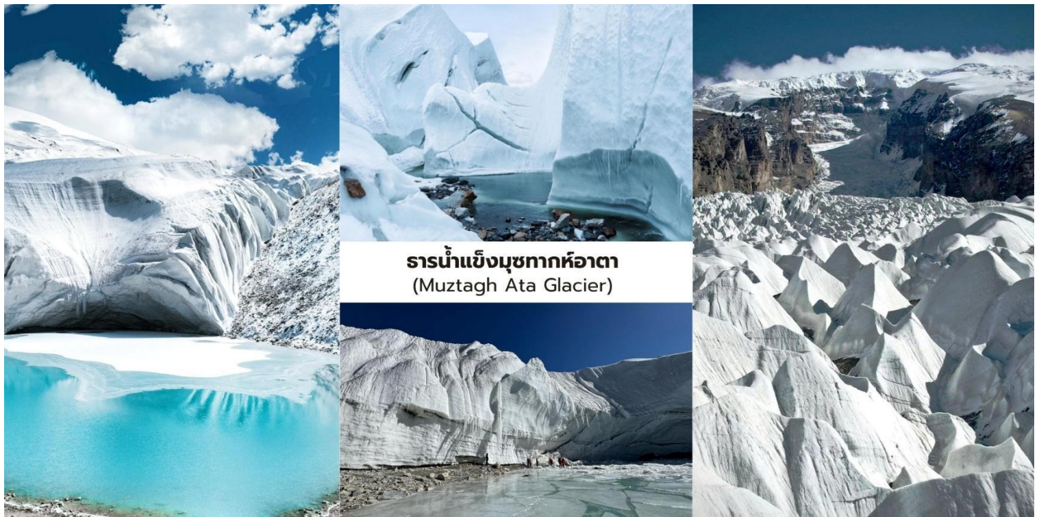
ธารน้ำแข็งมุขทากหืออาตา (Muztagh Ata Glacier)

นักท่องเที่ยวจะได้ โดยสารรถกอล์ฟไฟฟ้าของอุทยาน (รวมในรายการ) ลัดเลาะเข้าไปยังบริเวณเชิงเขาเพื่อชม ธารน้ำแข็งขนาดใหญ่ ที่ไหลลงมาจากยอดเขา ท่ามกลางทัศนียภาพของภูเขาหิมะและทุ่งน้ำแข็งที่ทอดยาวสุดสายตาให้ความรู้สึกถึงความยิ่งใหญ่ของธรรมชาติบนที่ราบสูงปามีร์ระหว่างทางอาจพบกับจามรี (Yak) ที่อาศัยอยู่ในพื้นที่ธรรมชาติของที่ราบสูงรวมถึงทิวทัศน์ภูเขาหิมะที่สวยงามเหมาะสำหรับการถ่ายภาพและชมธรรมชาติอันบริสุทธิ์