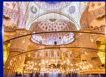
เข้าชมความงามสุเหร่าสีน้ำเงิน