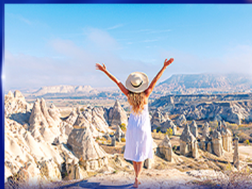
ชมความงดงาม หุบเขาแห่งรัก