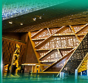
พิพิธภัณฑ์เกรนด์อียิปต์ (GEM)