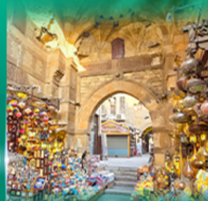
ตลาดข่านเอลคาลิลี