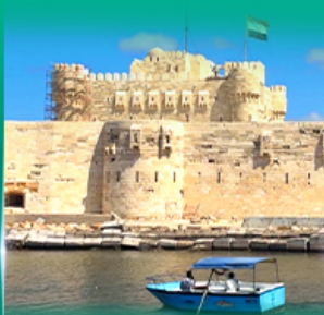
ป้อมปราการ Quite Bay