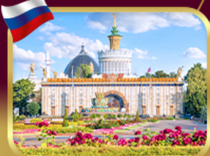
สวนสาธารณะ VDNKH