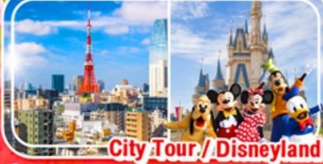
City Tour / Disneyland