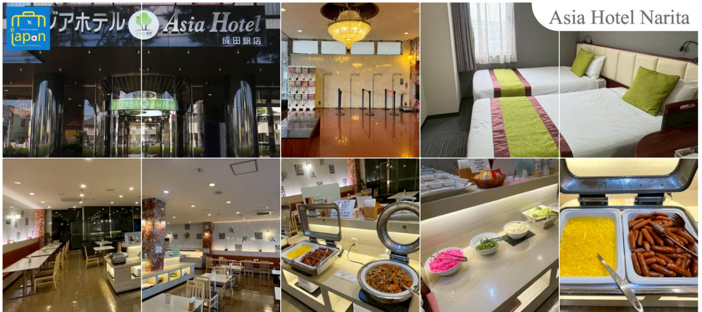
Asia Hotel Narita

พักที่ ASIA HOTEL NARITA หรือเทียบเท่าระดับเดียวกัน