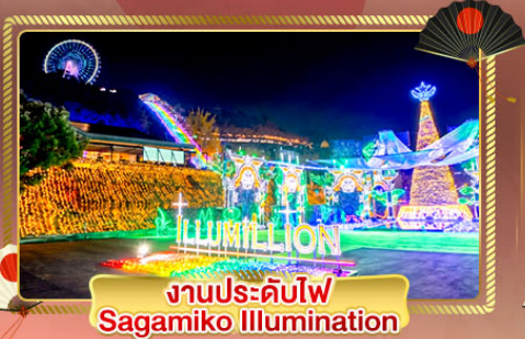
งานประดับไฟ Sagami Illumination