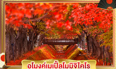
อุโมงค์เมเปิ้ลโมมิจิโคโร