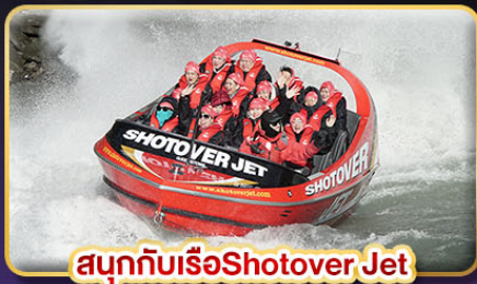
สนุกกับเรือ Shotover Jet