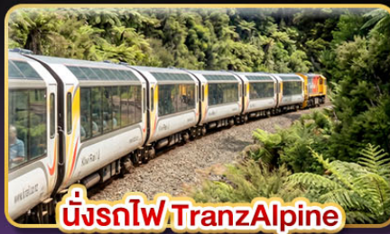
นั่งรถไฟ TranzAlpine