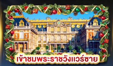
เข้าชมพระราชวังแวร์ซาย