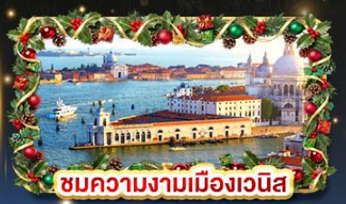
ชมความงามเมืองเวนิส