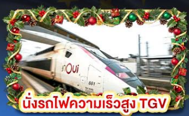
นั้รรถไฟความเร็วสูง TGV

📞 เดินทาง: 01-10 ธ.ค. 69 04-13 ธ.ค. 69 | 30 ธ.ค. - 08 ม.ค. 70