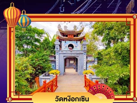
วัดหิ่งห่อ