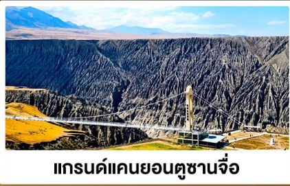
แกรนด์แคนยอนตู่ชานจื่อ