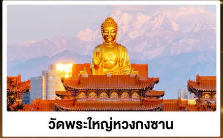
วัดพระใหญ่หวงกงชาน