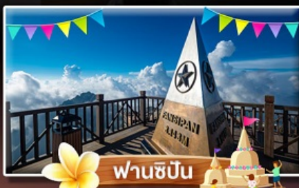
ฟานชิปัน