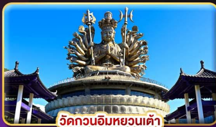
วัดกวนอิมหยวนเต๋า