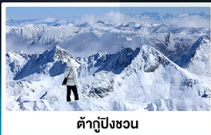
ต้ากู่ปิงชวน